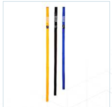
TA-0048 | TA-0049 | TA-0050