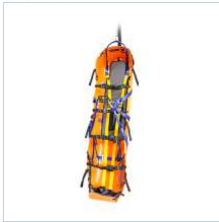
TX-0048 | TX-0056