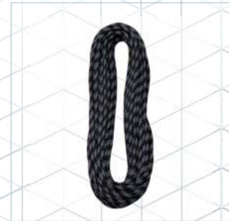
TR-0031 | TR-0032 TR-0033 | TR-0040