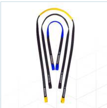
TA-0051 | TA-0052 | TA-0053