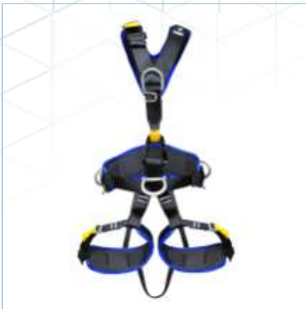
TC-0020 (S) | TC-0018 (ML) TC-0019 (XL)