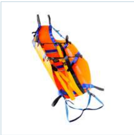
TX-0041 | TX-0042