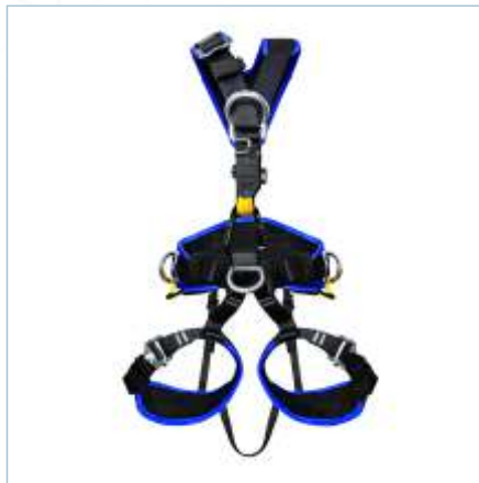
TC-0031 (S) | TC-0029 (ML) TC-0030 (XL)