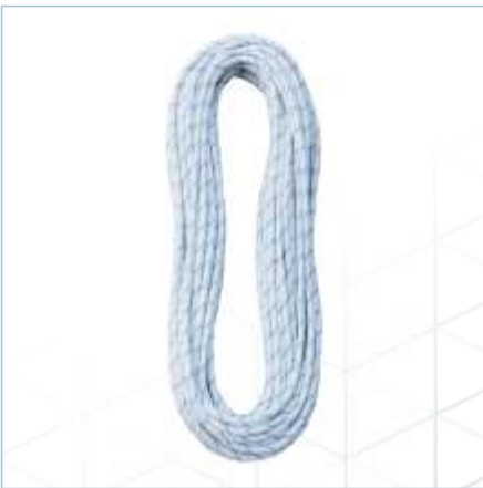
TR-0025 | TR-0026 TR-0027 | TR-0038