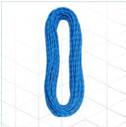
TR-0028 | TR-0029 TR-0030 | TR-0039