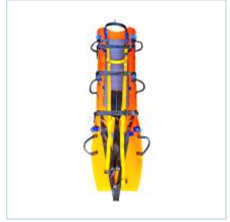
TX-0045 | TX-0049