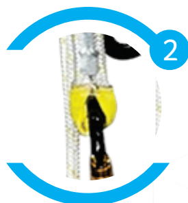
Corda com olhal costurado na ponta