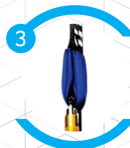
Acompanha duas fitas de ancoragem