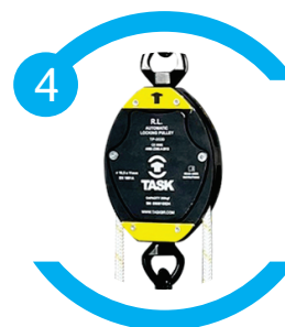
Mecanismo de bloqueio ou desbloqueio automático