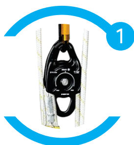
Com duas polias duplas