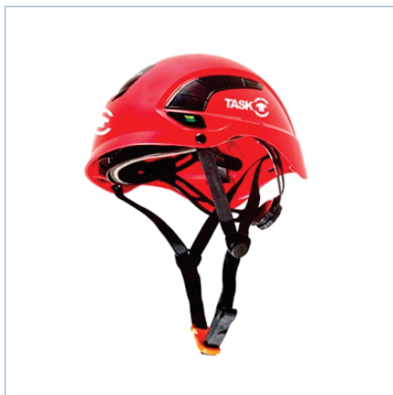
TL-0007 | TL-0006 | TL-0005