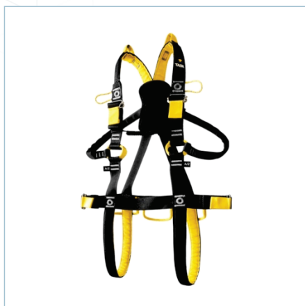
TC-0146 (S) | TC-0144 (ML) TC-0145 (XL)