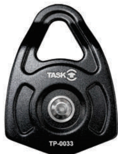
BIG SINGLE TECH