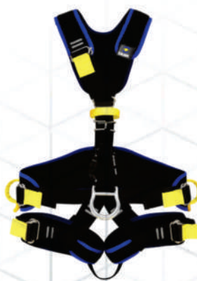
FIVEX LIGHT II®