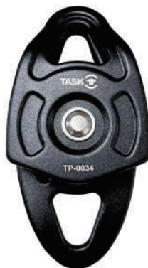
BIG DOUBLE TECH