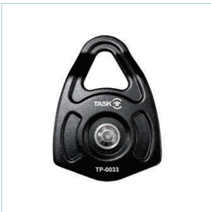
BIG SINGLE TECH