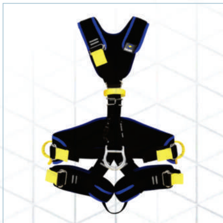
FIVEX LIGHT II®