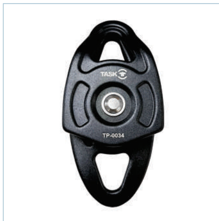
BIG DOUBLE TECH