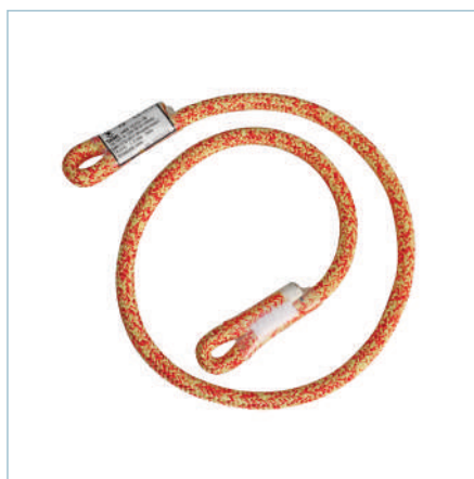
TR-0098 | TR-0100 | TR-0101