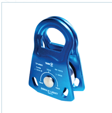
TP-0062 | TP-0063