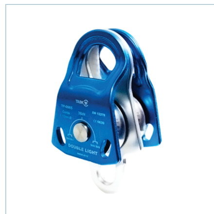
TP-0064 | TP-0065