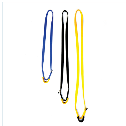
EYE DOUBLE LINK