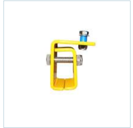
TLV-0247 | TLV-0270