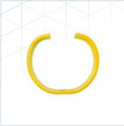
TLV-0245 | TLV-0269