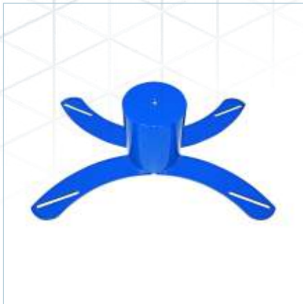
TLV-0244 | TLV-0268