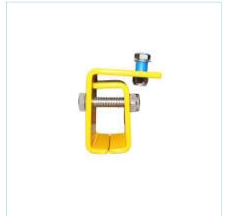
TLV-0247 | TLV-0270