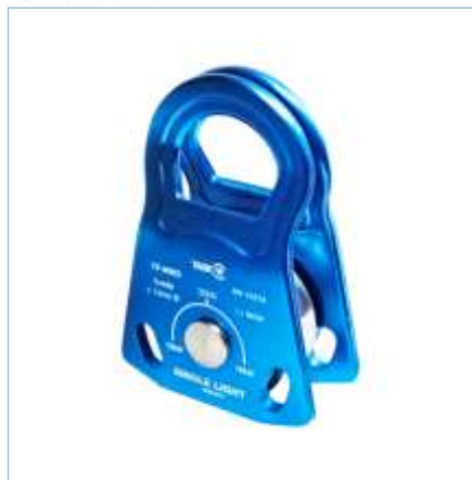
TP-0062 | TP-0063