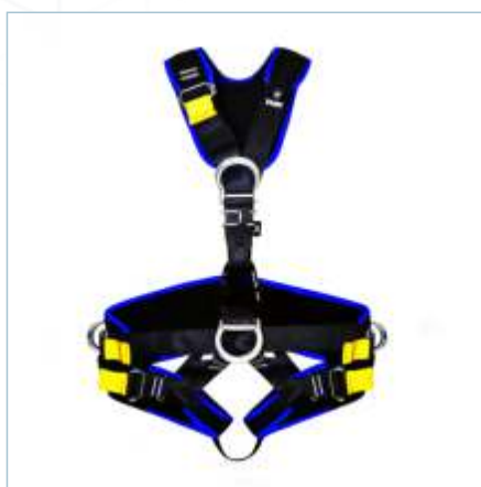
TC-0020 (S) | TC-0018 (ML) TC-0019 (XL)