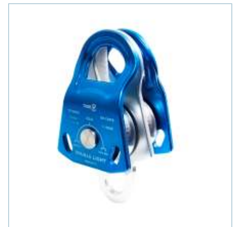
TP-0064 | TP-0065