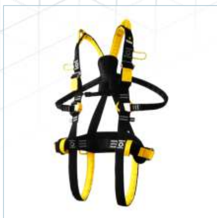
TC-0149 (S) | TC-0147 (ML) TC-0148 (XL)