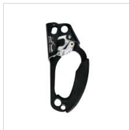
TB-0001 | TB-0003