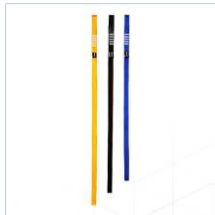
TA-0048 | TA-0049 | TA-0050