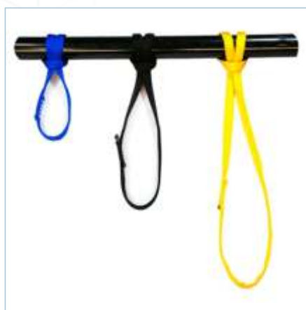
TA-0055 | TA-0056 | TA-0057