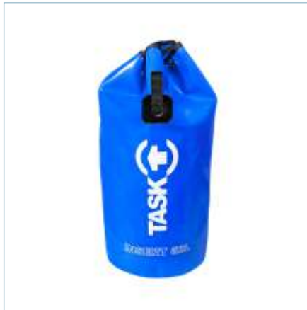
TL-0078 | TL-0079