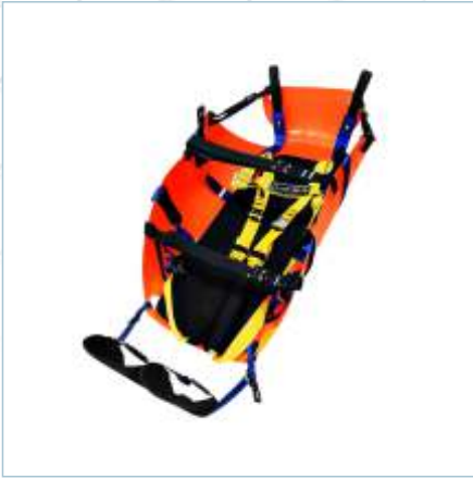
TX-0041 | TX-0042