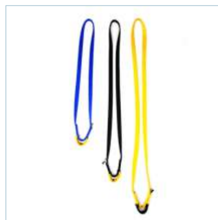
TA-0058 | TA-0059 | TA-0060