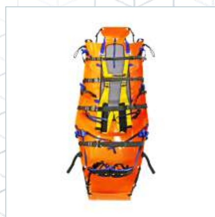
TX-0048 | TX-0056