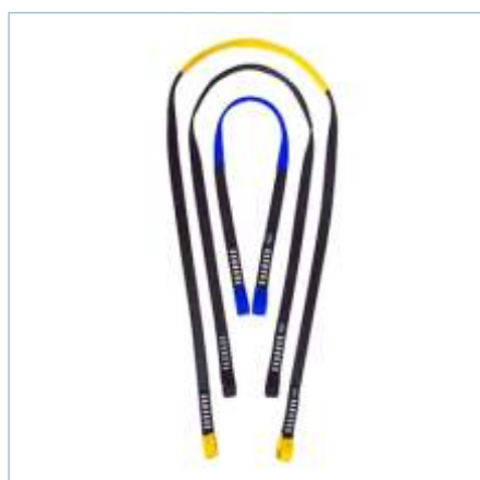
TA-0051 | TA-0052 | TA-0053