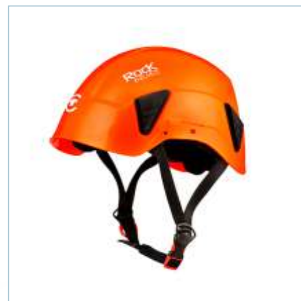
TL-0107 | TL-0108 TL-0109 | TL-0110