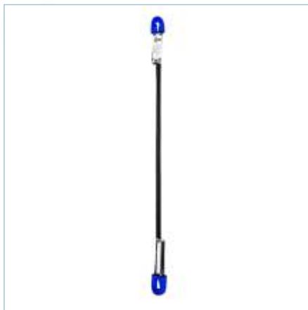
TC-0010 | TC-0013