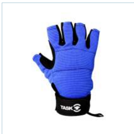
TL - 0095 (Preto - G) | TL - 0101 (Azul - G)