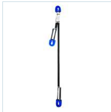
TC-0009 | TC-0011