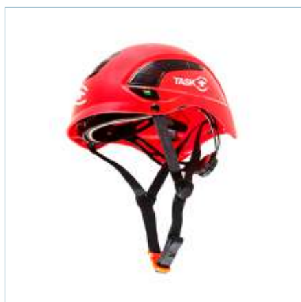
TL-0007 | TL-0006 | TL-0005