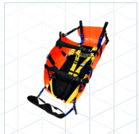
TX-0041 | TX-0042