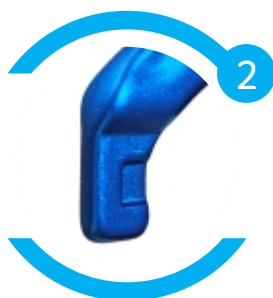
Trava modelo Keylock - não enrosca