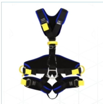
TC-0109 | TC-0107 | TC-0108