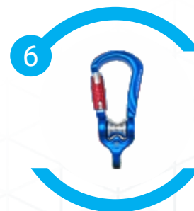
Utilizado para operações especiais (pessoais e coletivas)