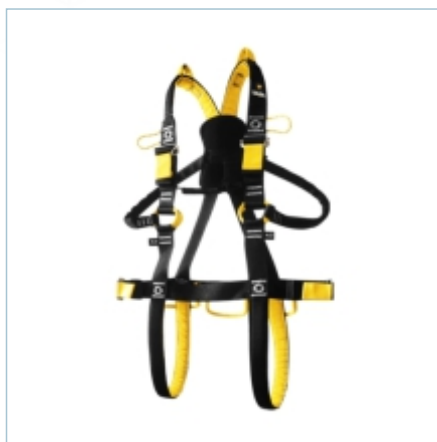
TC-0146 | TC-0144 | TC-0145