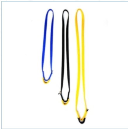
TA-0058 | TA-0059 | TA-0060