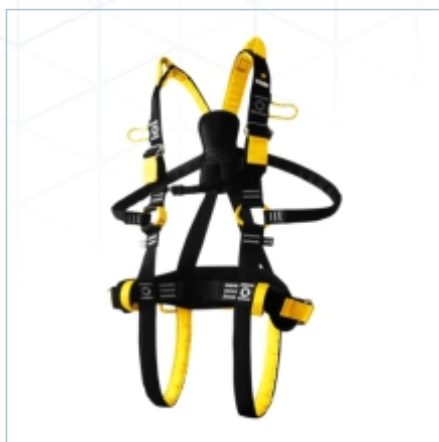
TC-0149 | TC-0147 | TC-0148