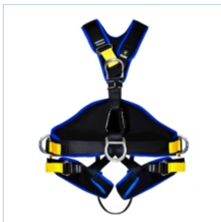
TC-0031 | TC-0029 | TC-0030