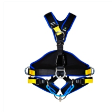
TC-0031ARB | TC-0029ARB | TC-0030ARB