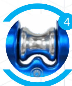
Rolamento selado de 4kN, compatível com cordas de 5 a 13mm