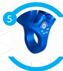
Olhal incorporado de 18mm de diâmetro e 25kN de resistência