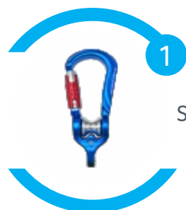
Sistema 3 em 1