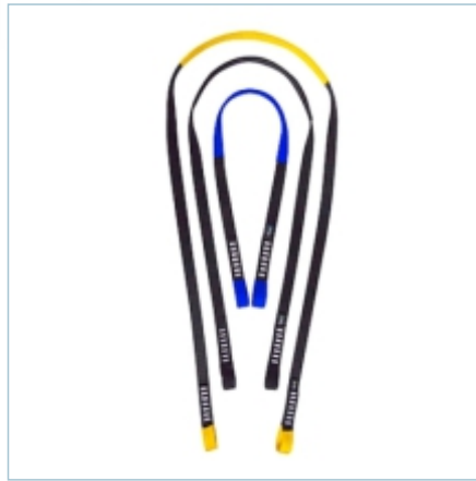
TA-0051 | TA-0052 | TA-0053