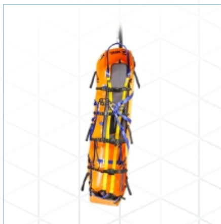
TX-0048 | TX-0056