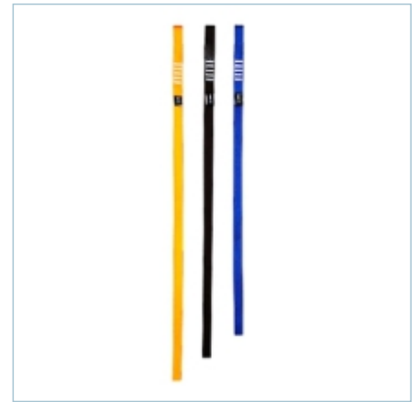
TA-0048 | TA-0049 | TA-0050