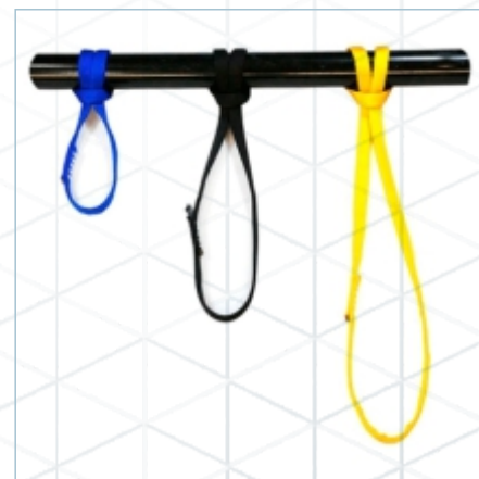
TA-0055 | TA-0056 | TA-0057