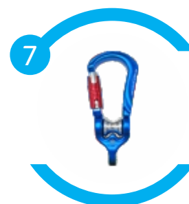
Leve e compacto com apenas 184g