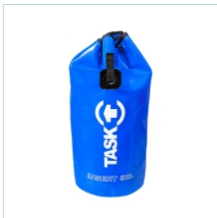
TL-0078 | TL-0079