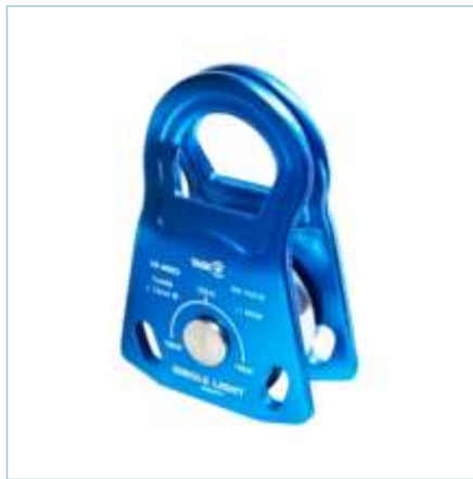
TP-0062 | TP-0063