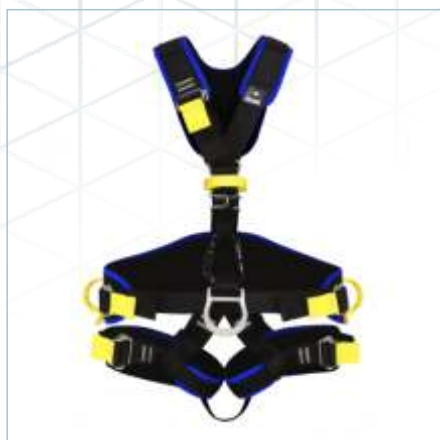
TC-0109 | TC-0107 | TC-0108