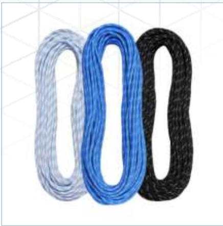
TR-0025 A 40