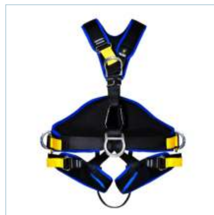
TC-0029 | TC-0030 | TC-0031