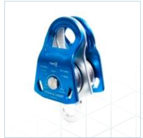
TP-0064 | TP-0065