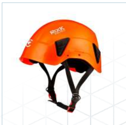
TL-0107 | TL-0109 | TL-0110 | TL-0111