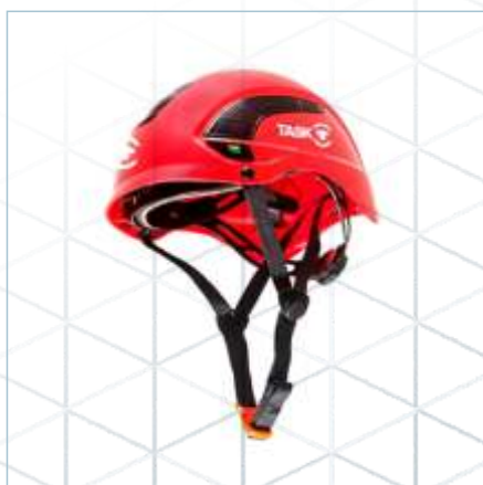
TL-0007 | TL-0006 | TL-0005 | TL-0074