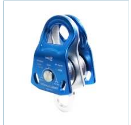
TP-0064 | TP-0065