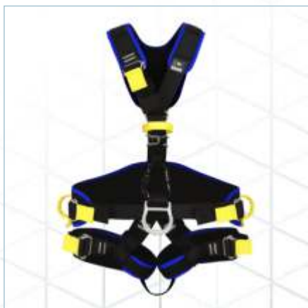
TC-0109 | TC-0107 | TC-0108