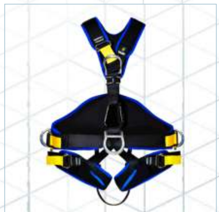
TC-0031 | TC-0029 | TC-0030