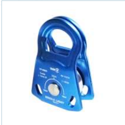
TP-0062 | TP-0063