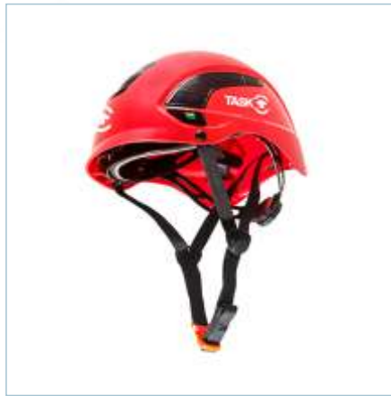
TL-0007 | TL-0006 | TL-0005