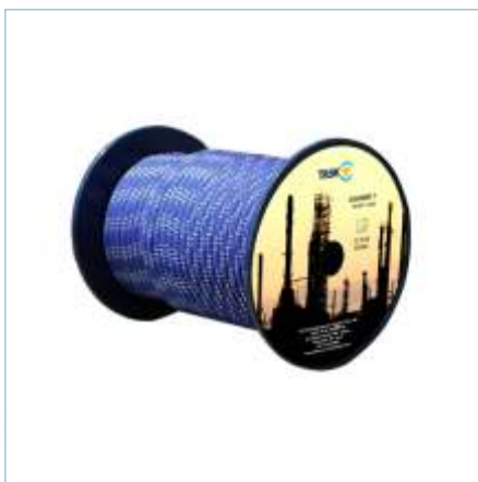
TR-0035 | TR-0036 | TR-0037