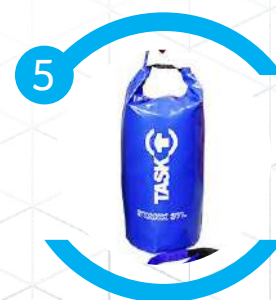
Acompanha bolsa STANK 20 ou 37