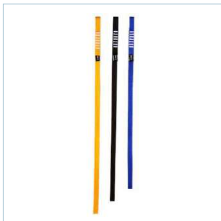
Anel de fita LINK

TA-0048 (Azul) | TA-0049 (Preto) TA-0050 (Amarelo)