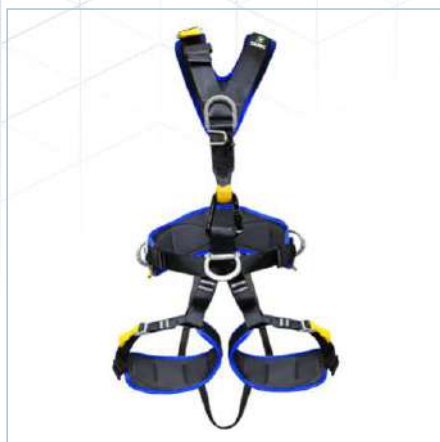
TC-0020 (S) | TC-0018 (ML) TC-0019 (XL)