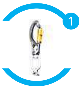
Conectores tipo T com trava automática