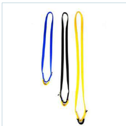
Anel de fita EYE DOUBLE LINK

TA-0058 (Azul) | TA-0059 (Preto) TA-0060 (Amarelo)