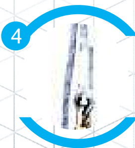
Acompanha corda de 10,5mm de diâmetro