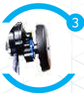
Adaptador de 3/8 para uso de parafusadeira elétrica