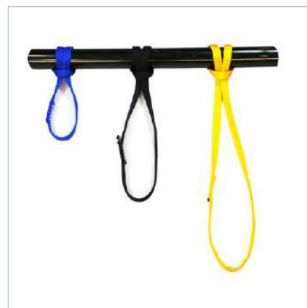
Anel de fita DOUBLE LINK

TA-0055 (Azul) | TA-0056 (Preto) TA-0057 (Amarelo)