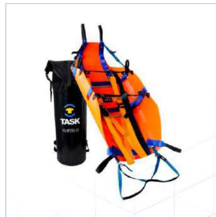
TX-0041 (Laranja) | TX-0042 (Preto)