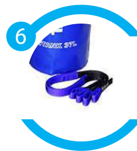
Fita de ancoragem I-SLING de 1m