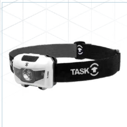
TL-0067 | TL-0068