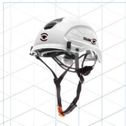
Capacete FOCUS ELETRO

TL-0007 (Branco) | TL-0006 (Vermelho) TL-0005 (Amarelo) | TL-0074 (Preto)