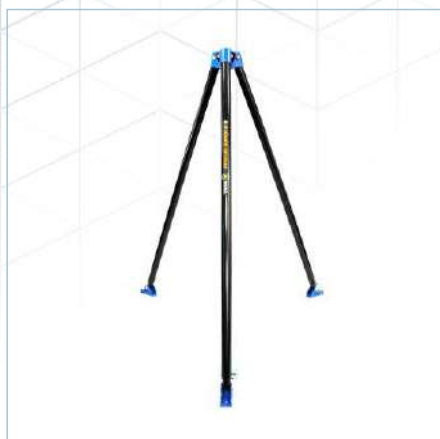
Tripé RESCUE SUPER II