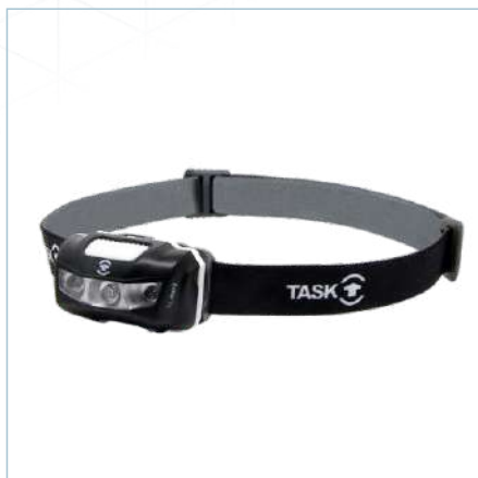
TL-0069 | TL-0070