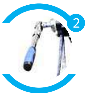
Possui chave de catraca extensível de 1/2"