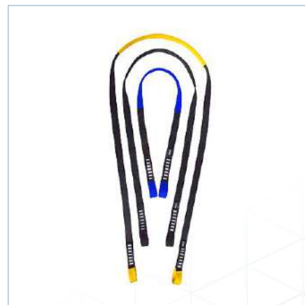
Fita de ancoragem I-SLING

TA-0051 (Azul) | TA-0052 (Preto) TA-0053 (Amarelo)