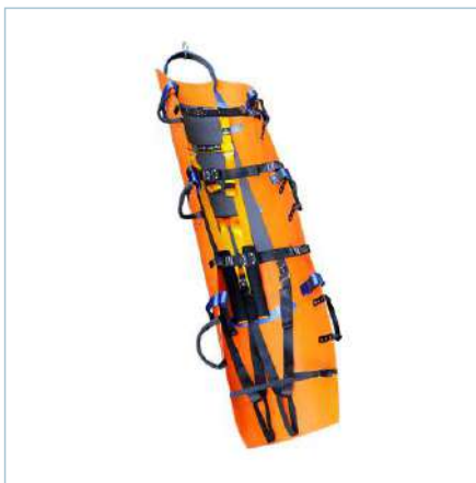
TA 0TX-0045 (Classic Orange) TX-0049 (New Black)